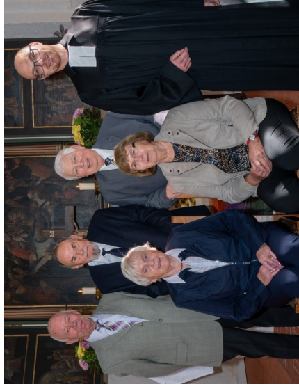
Eiserne Konfirmation 1955