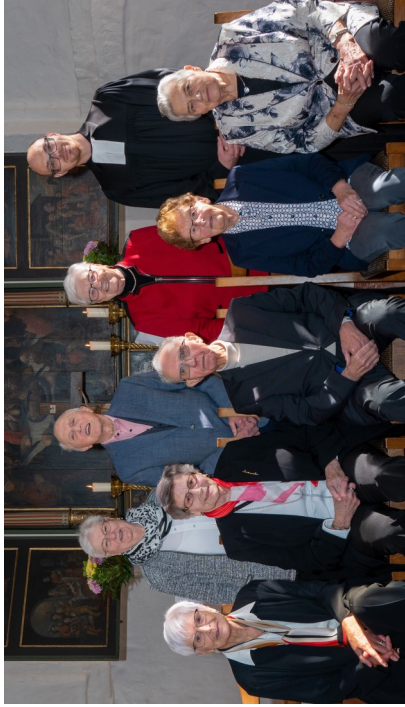
Gnaden Konfirmation 1950

Am 17. Sonntag nach dem Dreifaltigkeitsfest trafen sich die Konfirmationsjahrgänge, die Eiserne Konfirmation (65 Jahre) und Gnadenkonfirmation (70 Jahre) feiern konnten. Aufgrund des Corona-Rückbaus trafen sich mehrere Konfirmationsjahrgänge: