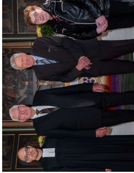
Eiserne Konfirmation 1956