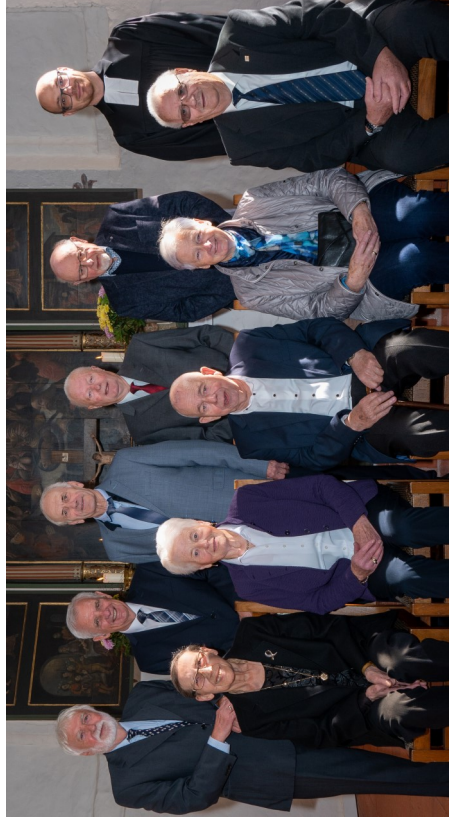
Eiserne Konfirmation 1957