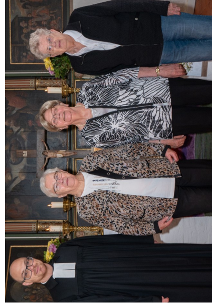
Eiserne Konfirmation 1954