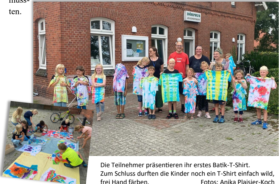
Die Teilnehmer präsentieren ihr erstes Batik-T-Shirt. Zum Schluss durften die Kinder noch ein T-Shirt einfach wild, frei Hand färben.

Regulär ist der Jugendtreff erst für Kinder ab 10 Jahren geöffnet; es gab im Vorfeld aber schon Anfragen erster Neugieriger, die bis zum Jugendalter noch warten müssen, so entstand die Idee hierfür.