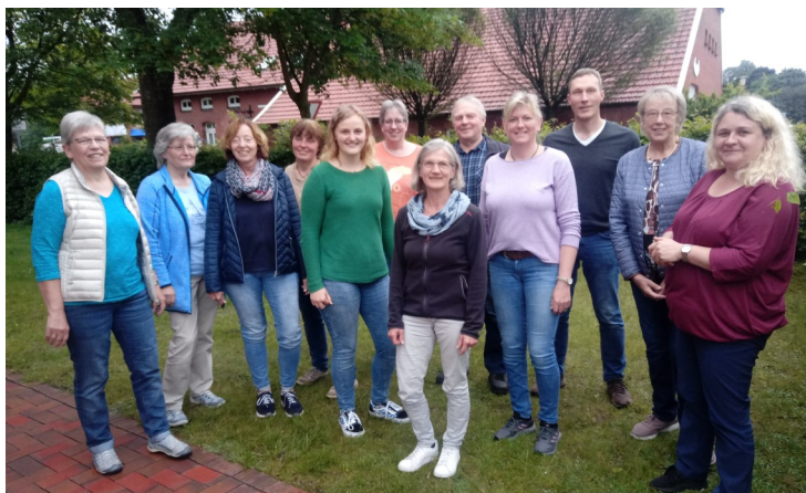
Die Kirchenvorstände Backemoor-Breinermoor und Collinghorst

Zur besseren Planung bittet das Team um Anmeldung bei Erika Eden: Tel: 825 0 595. Anstatt eines festen Teilnehmerbeitrags wird am Ausgang um eine Spende gebeten.