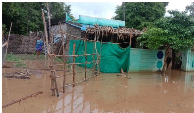
Bild: der Pegelstand des Godaveriflusses liegt bei 21 Meter über Normal (!).

unsere Partnerkirche Good-Shepherds Ev.-Luth.- Church