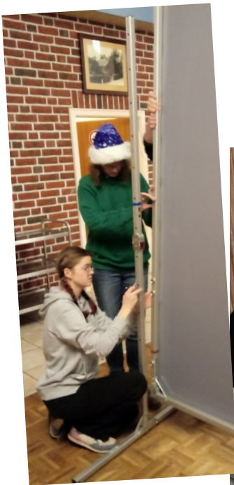
Aufbauen der Leinwand (o.) und Popcornverkauf (re).

Ausgesucht haben die Jugendlichen sich den Animationsfilm „Ferdinand - geht STIER-isch ab“. Der Eintritt wird wieder frei sein.