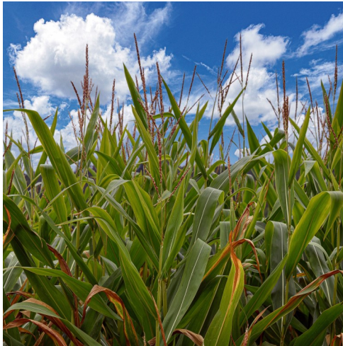
In der Natur scheint manchmal die Zeit still zu stehen.

Wie gelange ich zum wahren Leben? -vier Ideen: Leben bedeutet erstens „Zeit haben“. Je mehr Dinge ich versuche, zu vollbringen, desto mehr habe ich den Eindruck, keine Zeit zu haben. Eigentlich seltsam.