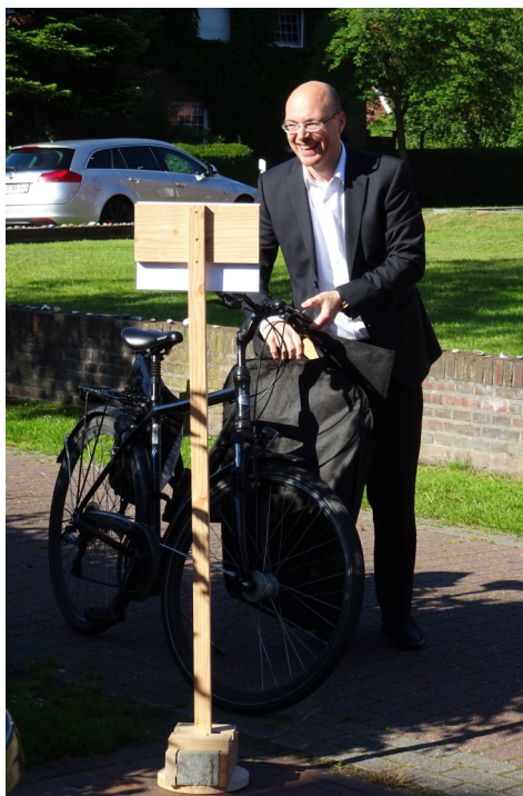
Bild: Geht auch: im Anzug mit Talar am Lenker zum Gottesdienst per Fahrrad.

Nicht nur in Ostfriesland, in ganz Deutschland bieten sich viele schöne