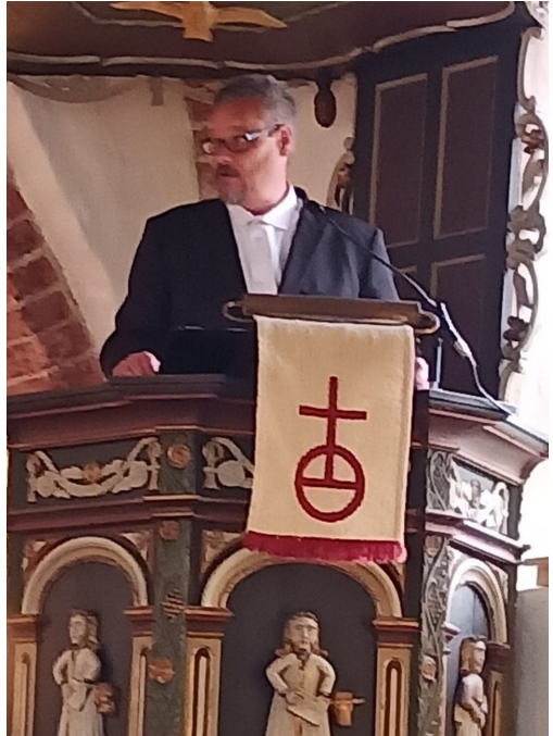
Eggert predigt im Einführungsgottesdienst.

Ich liebe es, zur Ehre des Herrn den Dienst als Lektor hier in der Gemein-