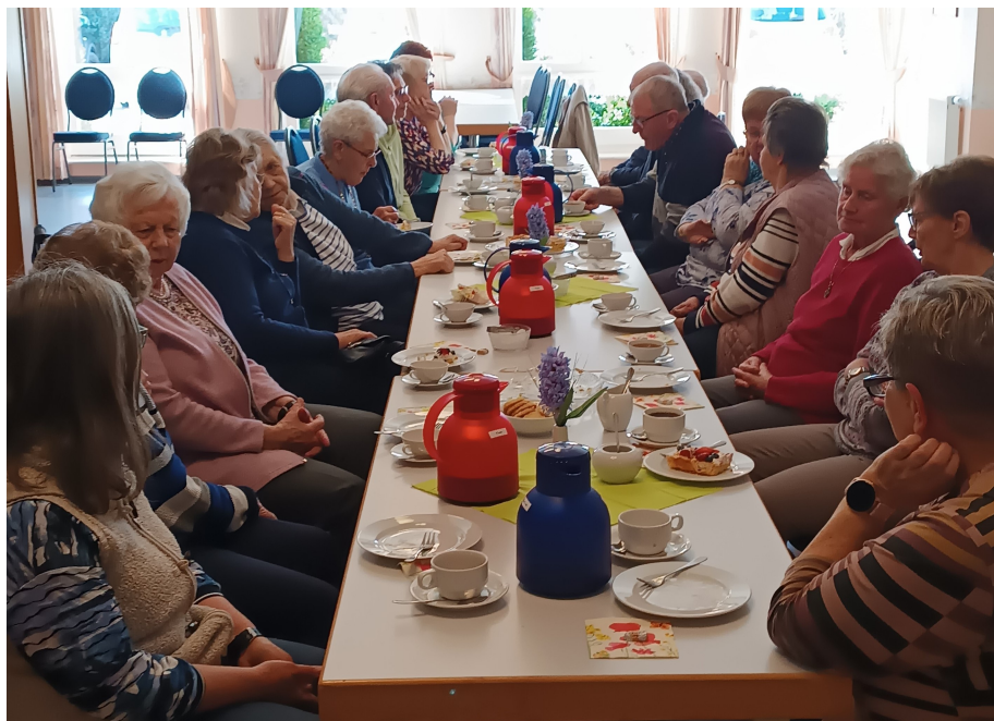
Foto: Das erste Teetrinken in netter Runde