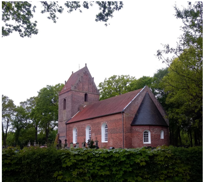
Die Backemoorer Kirche, umgeben von hohen Bäumen.

Wir sind nicht allein – und wir müssen auch nicht alles alleine schaffen.